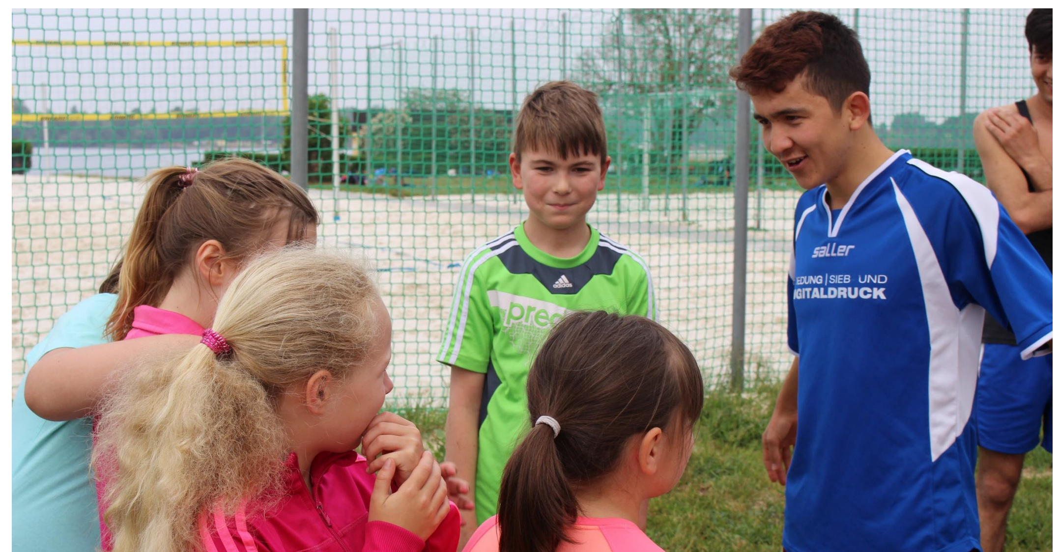
Kennenlernen am Barleber See (26.05.2016 |)