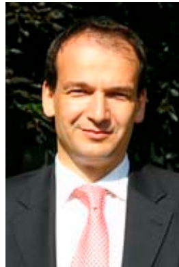
Andreas Silbersack Präsident des LandesSportBundes Sachsen-Anhalt e.V.